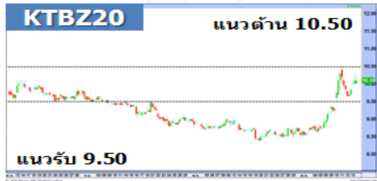
(กราฟทั้งหมดอ้างอิงจากหุ้นสามัญ)