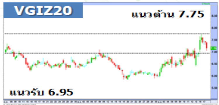
(กราฟทั้งหมดอ้างอิงจากหุ้นสามัญ)