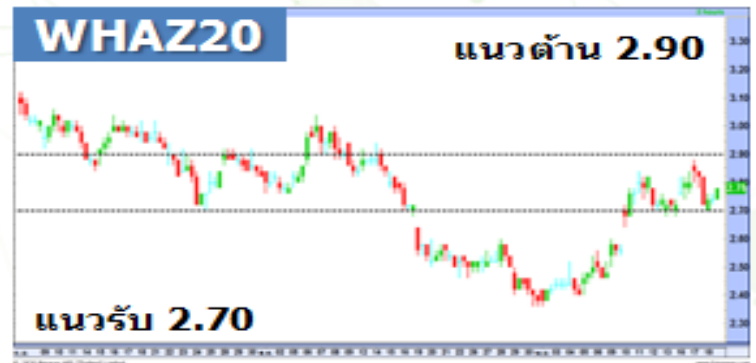
(กราฟทั้งหมดอ้างอิงจากหุ้นสามัญ)