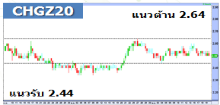
(กราฟทั้งหมดอ้างอิงจากหุ้นสามัญ)