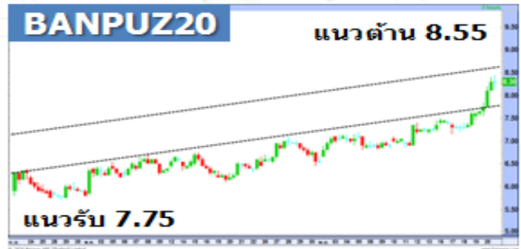
(กราฟทั้งหมดอ้างอิงจากหุ้นสามัญ)