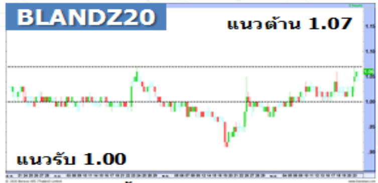
(กราฟทั้งหมดอ้างอิงจากหุ้นสามัญ)