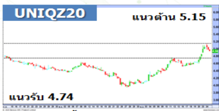
(กราฟทั้งหมดอ้างอิงจากหุ้นสามัญ)